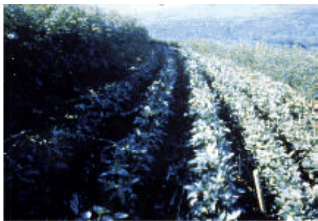
É importante plantar no contorno nas terras inclinadas

Nos campos planos a cerca deveria correr leste-oeste para evitar sombrear as colheitas.