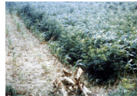
Campo de milho com Leucaena entre as filas. Depois da colheita deixe as arvores crescer um ou dois anos.