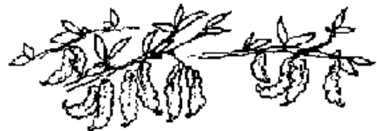
Feijão buero pode melhorar terras pobres sob condições secas. As ervilhas são muito nutritivas (dahl). Cresce até 2-3 m e fornece muito lenha.